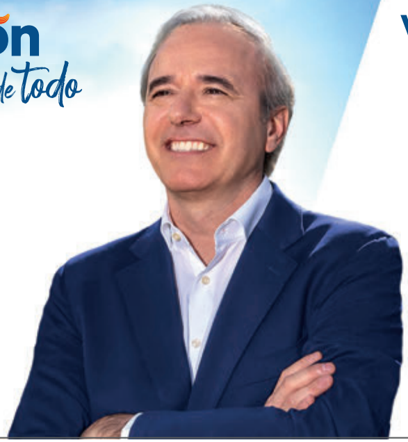
Jorge Azcón PRESIDENTE

Hoy, mi compromiso contigo para construir un Aragón mejor es: